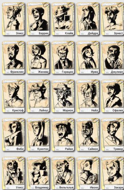
Разложенное игровое поле.

Выложите на столе 25 из 50 карт подозреваемых в виде квадрата 5 \times 5 . Возьмите и перемешайте 25 соответствующих им карт доказательств — это ваша колода доказательств. Рекомендуем использовать 25 «базовых» подозреваемых — внизу их карт нет цифр. Таким образом, вы сможете быстро просмотреть обе колоды и убрать все карты с отметками «6» и «7». Убедитесь, что колода доказательств в точности соответствует подозреваемым текущего игрового поля.